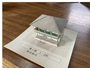
模型 (旧田代家西洋館)