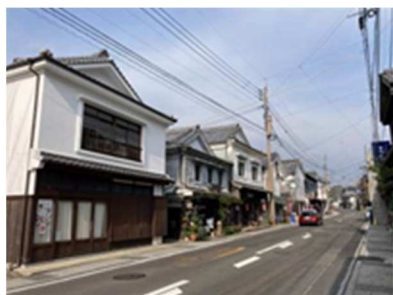
有田内山地区の街並み

有田町内山地区は重要伝統的建造物群保存地区に指定されており、ゴールデンウィークに行われる有田陶器市では全国からのたくさんのやきものファンで賑わいます。