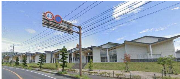
(嬉野市塩田中学校)