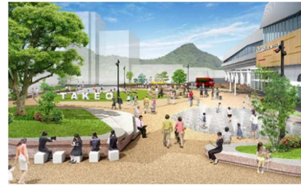
(武雄温泉駅前広場)